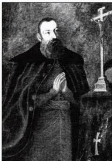
Hetman Stanisław Koniecpolski zwyciężając Szwedów pod Trzcianą broniał również wiary katolickiej Polski.

Nic tak nie ośmiela złych, jak tchórzostwo dobrych