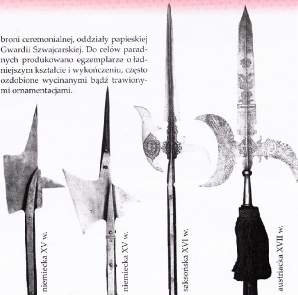
niemiecka XV w.

broni ceremonialnej, oddziały papieskiej Gwardii Szwajcarskiej. Do celów paradnych produkowano egzemplarze o ładniejszym kształcie i wykończeniu, często ozdobione wycinanymi bądź trawionymi ornamentacjami.